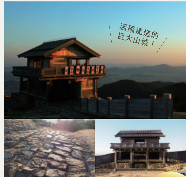
溫羅建造的 巨大山城！