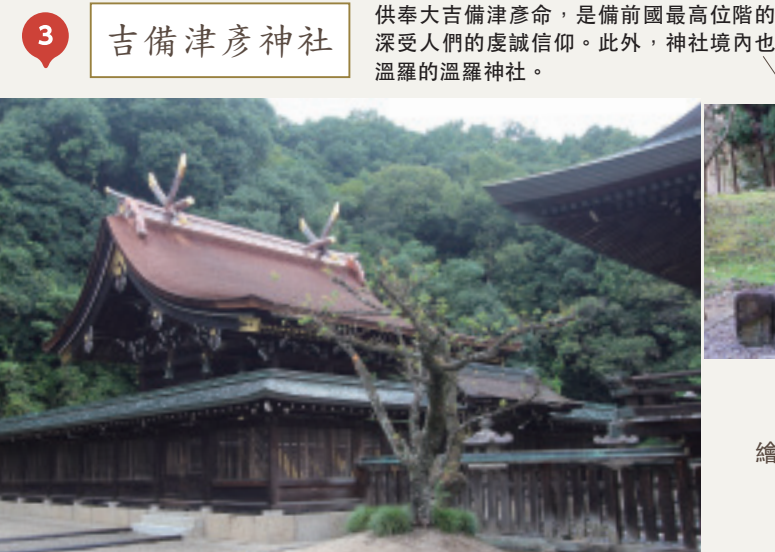
繪馬是桃子的形狀！